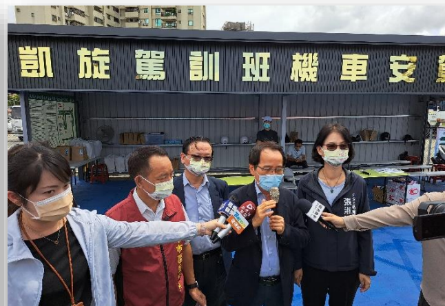
林副市長到場支持機車駕訓