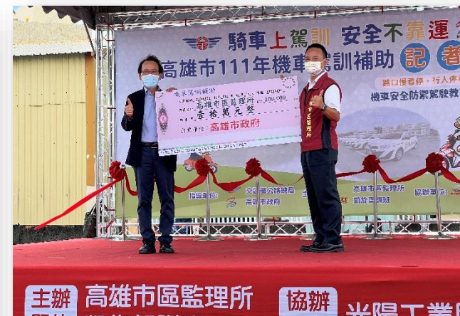
高市府加碼贊助機車駕訓