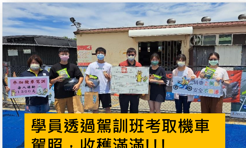
學員透過駕訓班考取機車駕照，收穫滿滿!!!