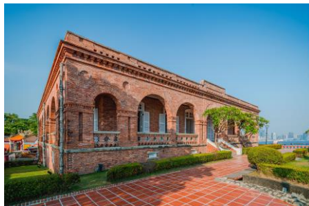
打狗英國領事館文化園區 (獲109年文化部國家文化資產保存獎) https://britishconsulate.khcc.gov.tw/