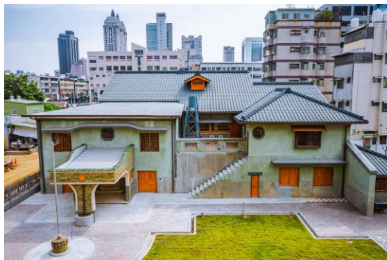
★逍遙園 (高雄一百活動期間新開園) https://www.facebook.com/xiaoyaotakao/