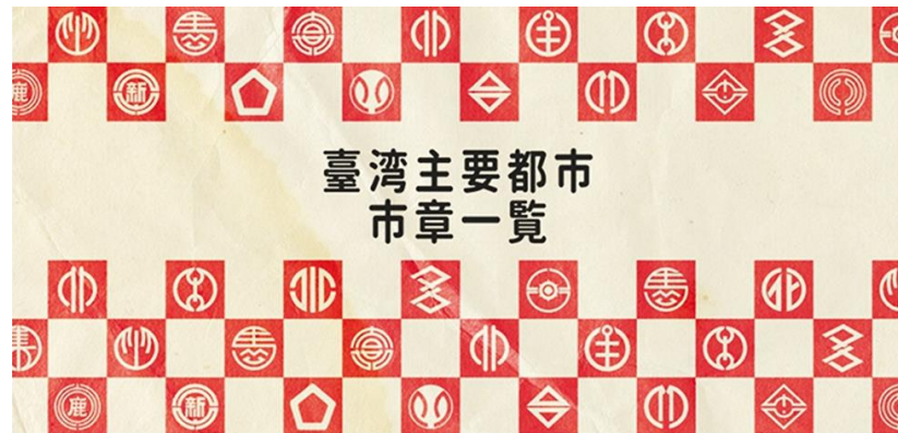
日治時期臺灣主要都市市章

「高雄一百」不僅是改制更名一百年，更是高雄成為現代化工業大城的發展歷程，也是臺灣移民城市的代表、臺灣民主運動的歷史縮影，更是高雄轉型改造的反省。透過 城市歷史探尋 ，鑑往知來，共同走向下一個百年。