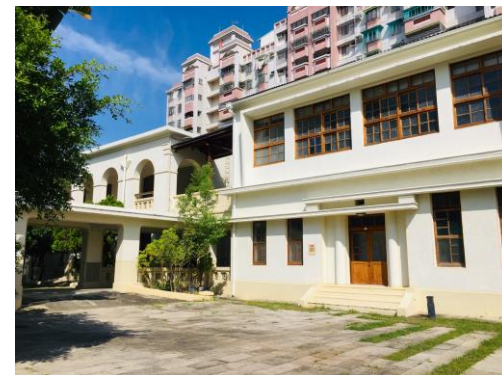
旗山生活文化園區 「市定古蹟舊鼓山國小」