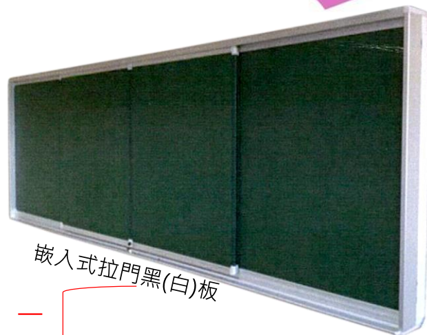
嵌入式拉門黑(白)板