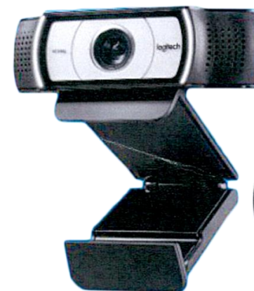
高解析度網路攝影機