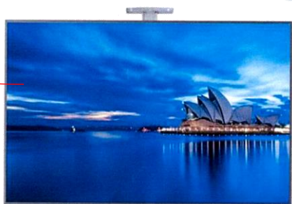
電動升降式電視移動架