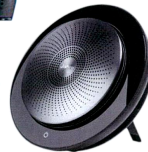
專業型藍芽麥克風