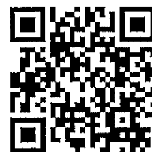
工作坊相關資訊 QR code