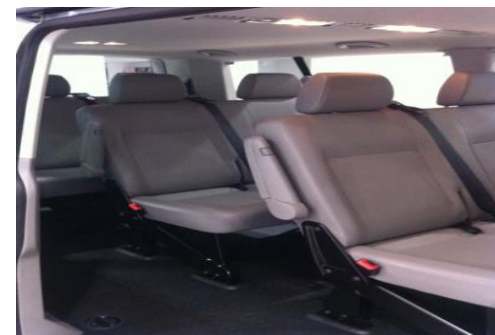
國小生（含以上）座椅樣式