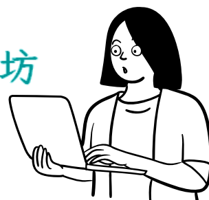
敘事類故事體 課程表