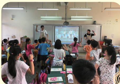
小朋友現場踴躍參與