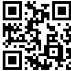
Google 線上報名網址 QR-Code

(二)報名系統網址： https://reurl.cc/WGLNeO (網址英文字之大小寫需一致)