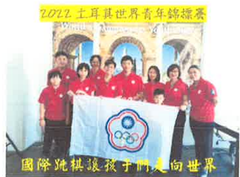
中山國小走出的小國手勇奪 U8 組第五名