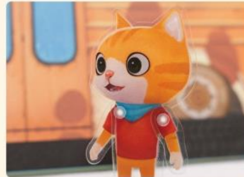
巴克里非常開心地答應了！