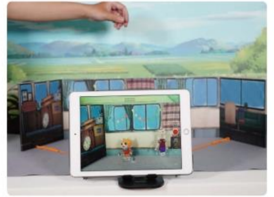
操控角色演出進行錄影