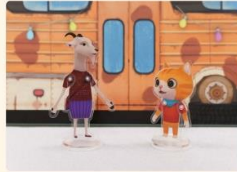
原來是小山羊的媽媽！