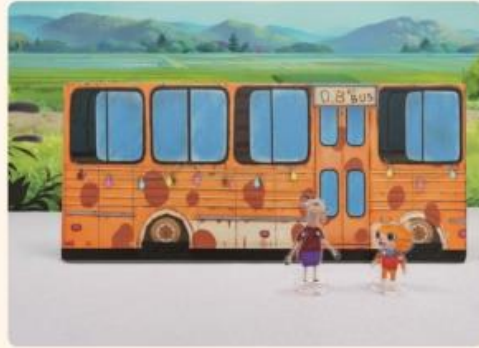
巴克里家有訪客到來