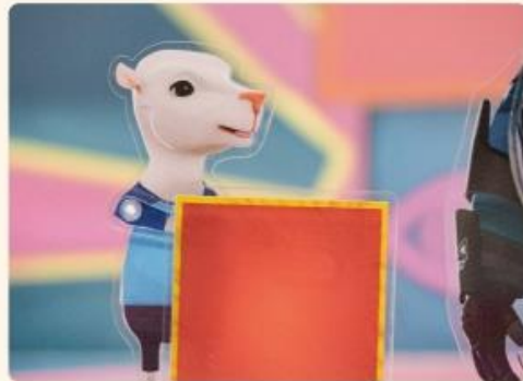
她邀請巴克里參加小山羊的魔術秀